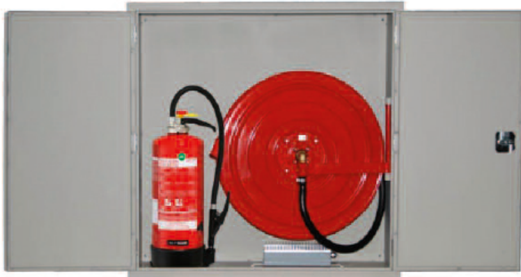
Individuell: Frost? Die Heizung sorgt dafür, dass der isolierte Löschposten immer einsatzbereit ist; 230 V-Anschluss