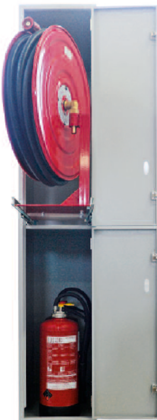
Individuell: bei schmalen Platzverhältnissen: Kasten mit Auszugshaspel