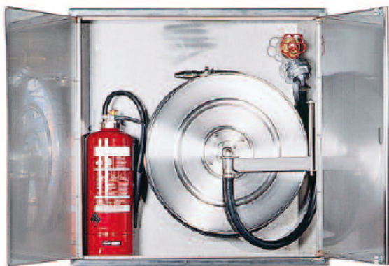
Kasten und Haspel aus rostfreiem Edelstahl