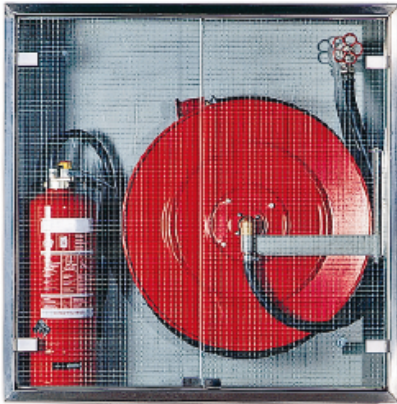
Individuell: z.B. Sicherheitsglas mit Drahtspiegeloptik