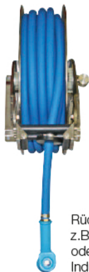
Rückzughaspel rostfrei z.B. für Fahrzeugpark oder Lebensmittel-Industrie