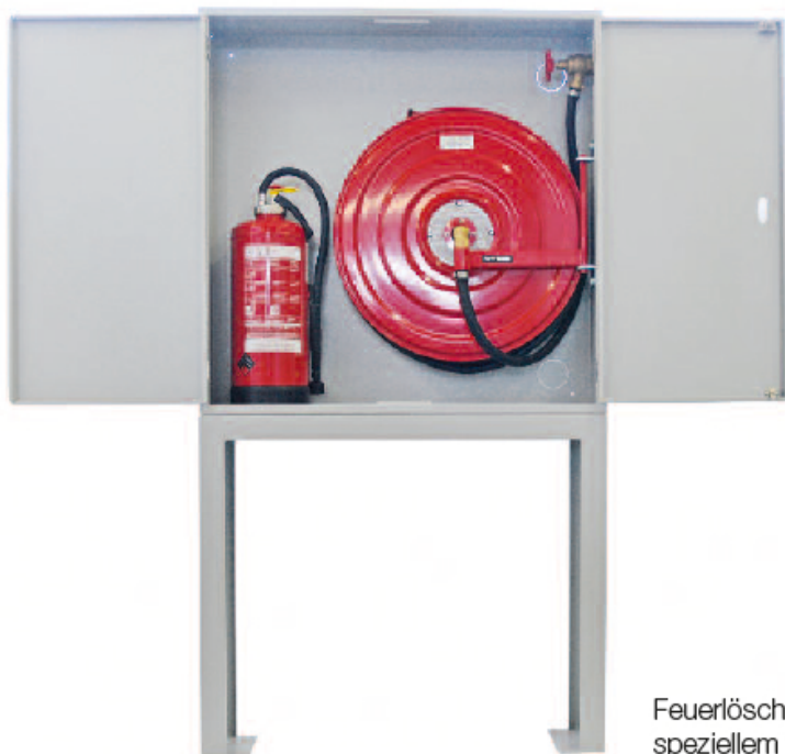
Feuerlöschposten mit speziellem Standfuss