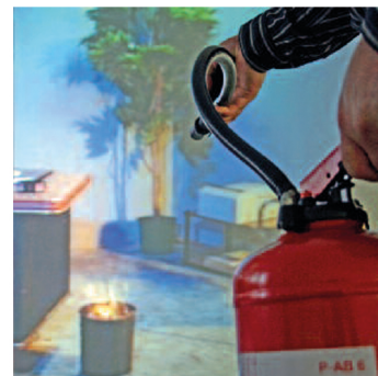
Cestino brucia virtualmente

BRANDSCHUTZ PROTECTION INCENDIE PROTEZIONE ANTINCENDIO