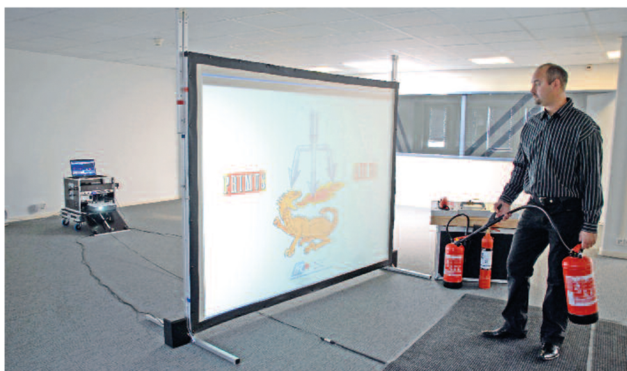
Proiettore / schermo per lo spegnimento virtuale