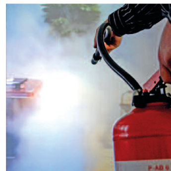
Un partecipante spegne in modo virtuale il fuoco del cestino

Primus AG Südstrasse 1 3250 Lyss Tel. 084 880 01 12 Tel. 061 436 50 50